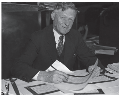
Arthur Wynne (* 1862 in Liverpool, † 1945)

Erfunden hat es der Journalist Arthur Wynne , nachdem ihn sein Chef beauftragt hatte, sich einen netten Zeitvertreib für die Weihnachtsbeilage auszudenken. Zwei Tage brütete Wynne vor sich hin und kreierte schliesslich aus 31 Suchbegriffen ein rautenförmiges Wortspiel, das er Word-Cross Puzzle nannte. Das Kreuzworträtsel von Wynne enthielt noch keine schwarzen Felder und war rautenförmig angeordnet.